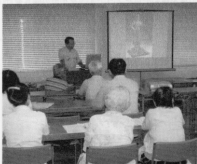
■ 速報展に伴い、那智・高野山に関わる講座を開催

Tel : 073 (433) 3843 Fax : 073 (425) 4595