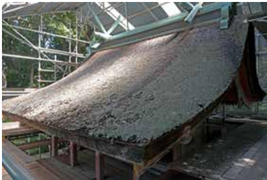
写真4 屋根面の劣化状況（南西から）

右は自然光、左は斜光にて撮影。現在は赤く塗られた後面にも前・側面と同様に彩色が存在していたことが判りました。