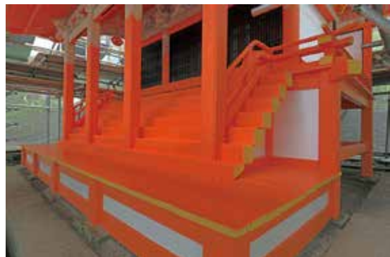
写真13 単色塗装の塗り替え（向拝、南西から）