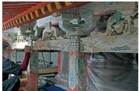
写真7 彩色部の調査状況（正面中央付近）