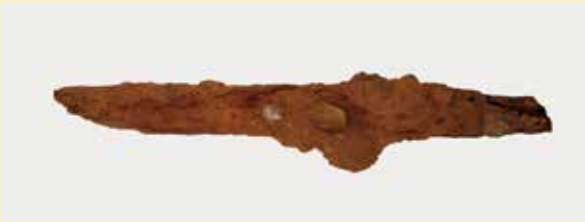
写真1 出土した状態の鉄製短刀