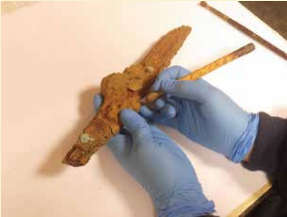
写真2 クリーニング作業（錆び取り）