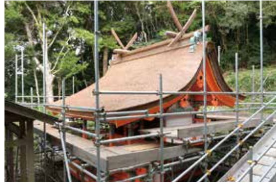
写真 17 素屋根解体中（南西から見る）