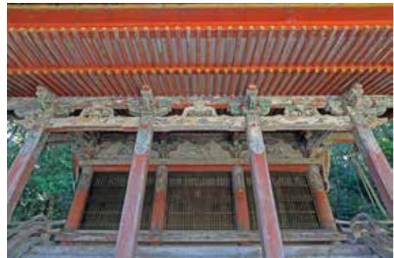
写真3 塗装・彩色の劣化状況（正面見上げ）