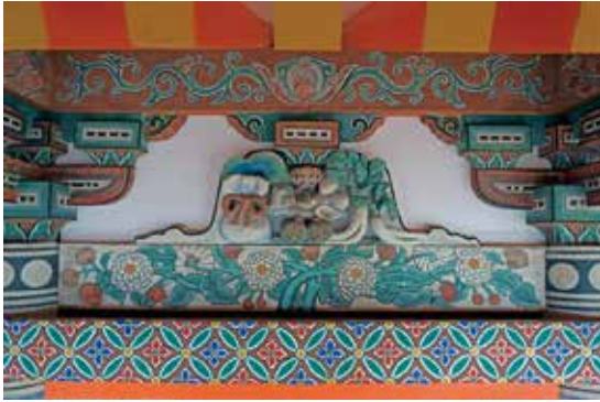
写真 20 正面中央間の臺股彫刻「大黒天（神）」