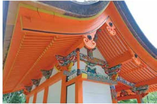
写真 19 修理後の塗装・彩色（北東から見上げる）