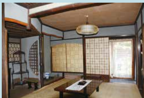
郭家住宅 座敷 九畳の間

陸奥宗光の生家である紀州藩士伊達家の屋敷の一部を移築したと伝えられる建物が、郭家住宅にあります。紀州藩の御典医であった郭家が、和歌山城下に建てた自宅兼民間医院で、令和6年8月に重要文化財に指定されました。郭百輔氏が明治10年に建てた洋館で有名ですが、その奥にある座敷が宗光ゆかりとされる建物で、自在な造りと稀少な素材を用いた煎茶席の趣が強い数寄屋造りです。