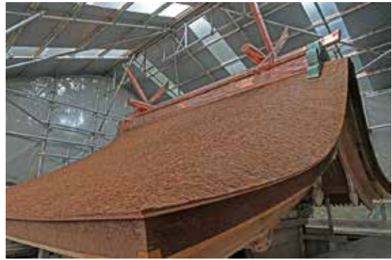
写真9 屋根面の復旧状況（南西から見上げる）