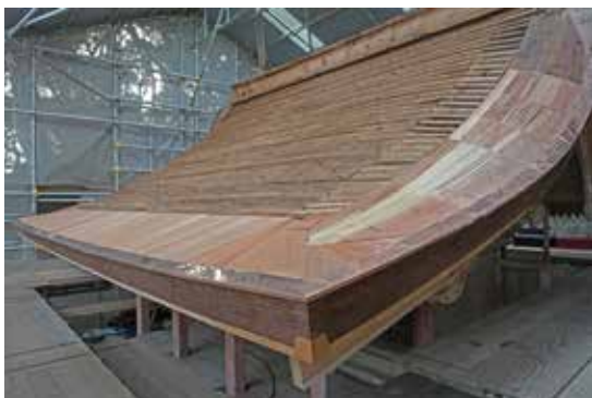
写真8 軒付・野地の復旧（南西から）