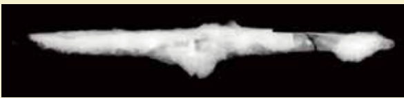
写真3 鉄製短刀のX線写真