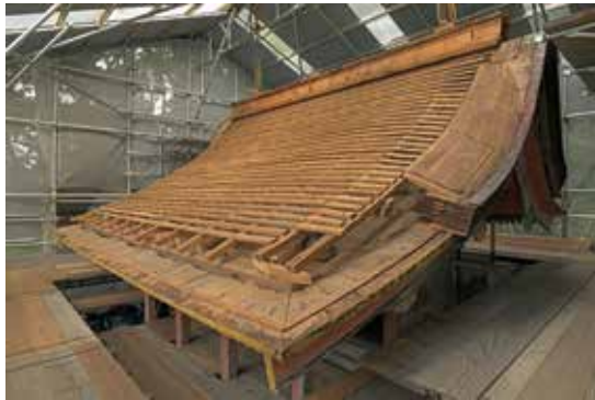
写真6 屋根面の解体（南西から）