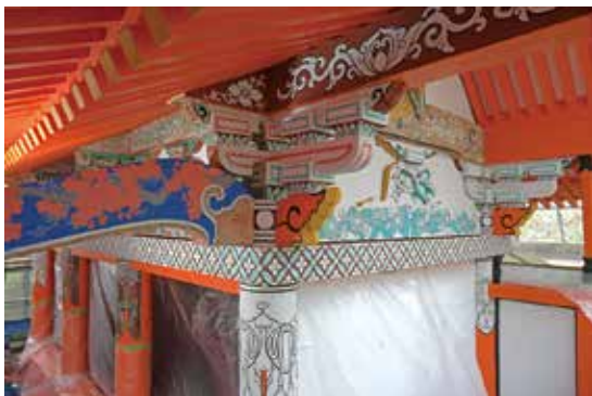
写真14 彩色部の描き直し（身舎、南西から）