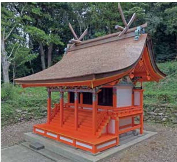
写真1 本殿の全景（竣工時、南西から見る）

本誌では、修理工事の経過を紹介するとともに、修理中に確認できた内容も一部紹介したいと思います。