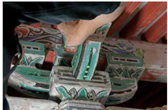
写真5 彩色部の保護（浮いた塗膜を定着させる）