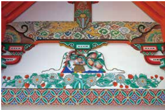
写真 22 南側面の臺股彫刻「西王母の桃」