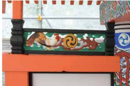
写真 21 北側脇障子の欄間彫刻「諫鼓鶏」

（画題の解説：西王母とは、道教における最上位の女神です。崑崙山 こんろんざん を統治し、後に不老不死の桃園を管理する天上の王母とされます。場面は、三千年に一度実を付ける桃を、東方朔 とうほうしやく が盗もうと伺っているところです。その悪事により現世へと流された東方朔は、やがて漢 ぼてい の武帝の重臣となり、武帝が不死の薬（西王母の仙桃）を求めた際、7月7日の訪問を取り持った、とも伝わります。後に『七夕』や『西遊記』の伝説とも結び付けられていく人物です。当時の日本への伝わり方やこの画題を選んだこと等を想像すると面白そうです。）