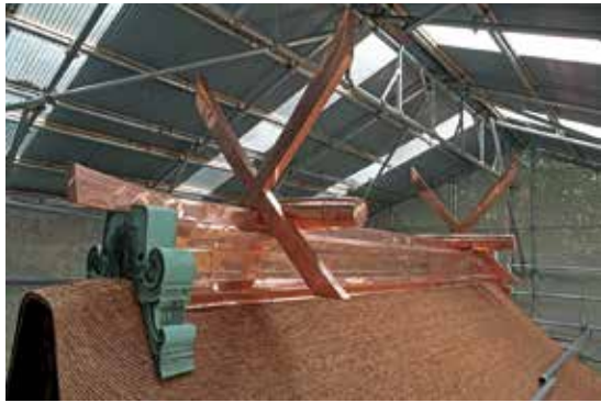
写真10 棟まわりの補修状況（銅板の巻き直し）