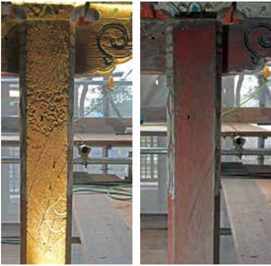
写真2 旧状の彩色痕跡（向拝柱の後面）

彩色部の調査は、昭和35年度の施工（描き直し）の再現を目的としましたが、保護作業中に江戸時代や再建当初に近い時期の彩色痕跡が複数確認できて、現在は赤や白に塗られた箇所にも彩色の存在が判りました（写真2）。そこで単色塗装の前に追加の調査を行い、その内容を記録することになりました。