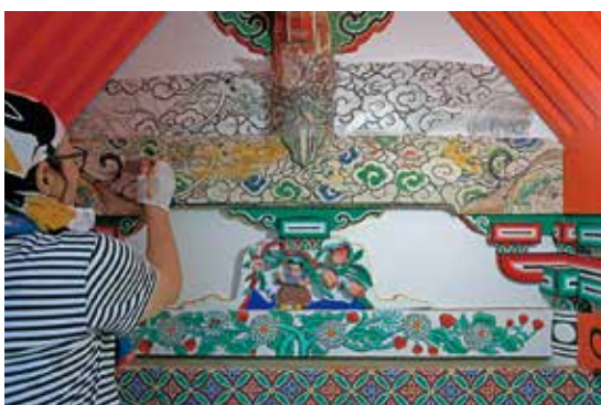
写真16 彩色部の補修（欠落した箇所を描き足す）