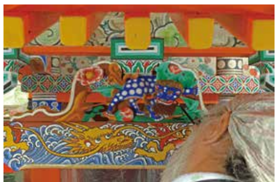
写真15 彩色部の描き直し（向拝頭貫・墓股）