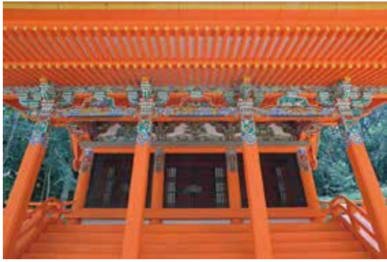
写真 18 修理後の塗装・彩色（正面見上げ）