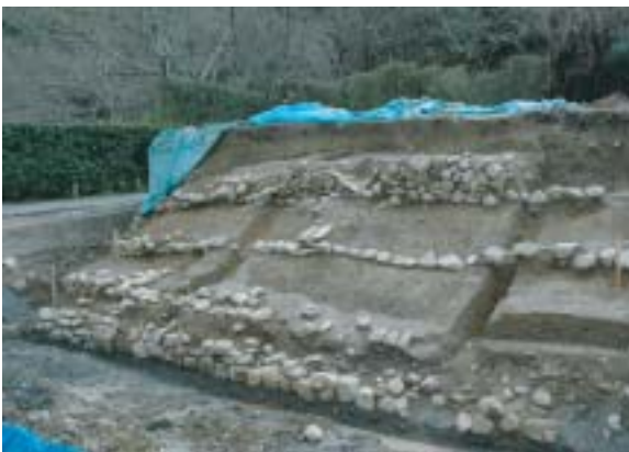
検出した4段の石積

この石垣を取り除き、整地された土などを掘り下げたところ、長屋川左岸の護岸・土留め施設と考えられる4段の石積遺構（左写真）が見つけられました。最下段基底部から最上段上端部までの高低差は約4mありま