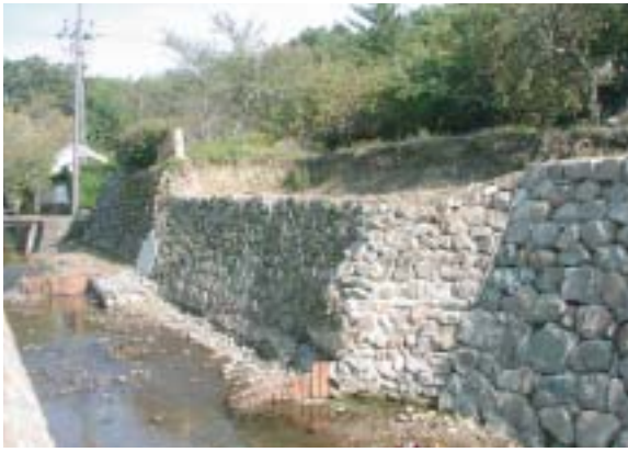
調査前まであった石垣

第4回歩いて知るきのくに歴史探訪の様子について説明してきましたが、現地説明会の時点では、調査地点の全容がまだわかっておりませんでしたので、ここではその後の発掘調査でわかったことを簡単に紹介します。