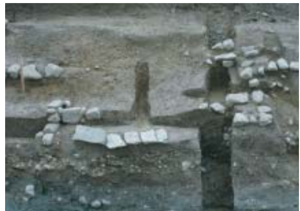
西側で検出した階段の痕跡？

す。各段の石積残存高さは50cm前後がほとんどですが、1m近い高さが残っている部分もあります。