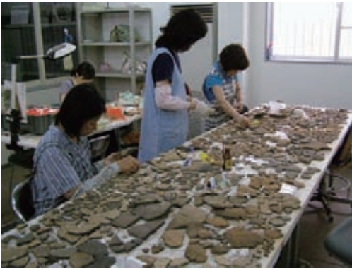
中飯降遺跡の縄文土器 接合作業中