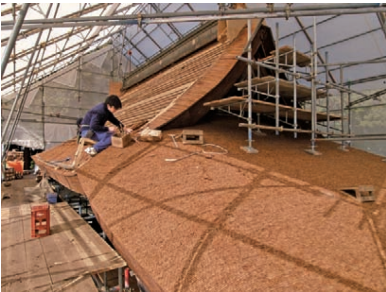
第四殿の屋根葺きの様子

修理は第三殿の屋根工事からとりかかりました。九月中旬より第三殿に素屋根（仮設足場）を建設し、屋根の檜皮を解体しました。千木、勝男木も屋根葺き替えのため、いったん解体し修理しました。第三殿の檜皮屋根をめく