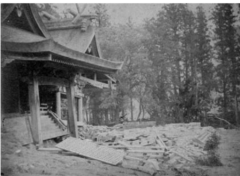
水害に遭った第三殿（手前）と第四殿

当社に残る古写真からは、第三殿は大きく傾き、第四殿は正面の向拝が取れて大破している状況がわかります。他の写真には崩壊してしまった社殿も写っています。まさに神社の歴史上、一番の大惨事であったといえるでしょう。