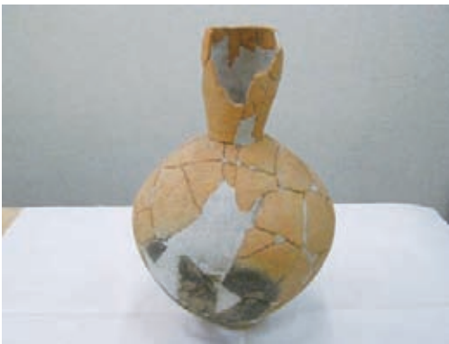
西飯降Ⅱ遺跡の弥生土器 復元作業後

所在し、紀ノ川中上流域の北岸の低位段丘上に立地します。縄文時代から弥生時代、古墳時代、古代・中世の各時代の遺構が重なって発見されました。特に、弥生時代から古墳時代（2000年前〜1400年前）には竪穴住居が密集しており、当時のこの周辺の中心的な集落であったことがわかります。