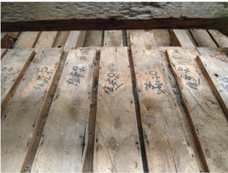
第四殿化粧裏板の移築番付（「〇北三十一後」などと記されている）

という、当時の人たちの熱い意志が伝わってくるのとともに、土木機械の無い時代、たった二年でこれだけの大移築工事を成し遂げた技術力、行動力に驚かされます。 (御船 達雄)