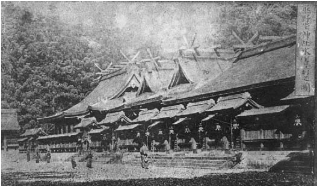
大齋原時代の社殿

りとると、表面は腐朽していましたが、中は比較的健全で、四十年経ても状態は良かったといえます。屋根野地の修理の後、在来通りに新たな檜皮で屋根を葺きました。屋根を葺き終えた