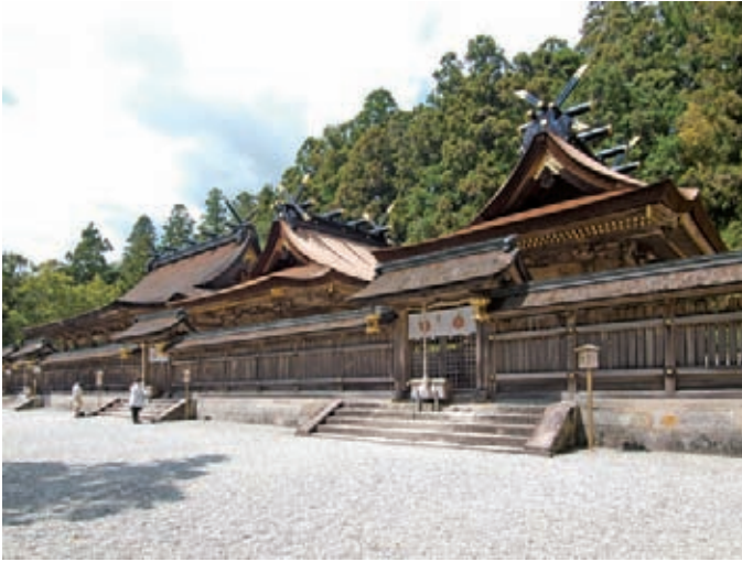
本宮大社の社殿近況 手前二棟が屋根工事完了した第三殿と第四殿、後ろがこれから修理をする第一殿・第二殿

熊野本宮大社では現在、重要文化財三棟の社殿の保存修理が行われています。第一殿・第二殿、第三殿、第四殿の檜皮屋根の葺き替えがその主な内容で、その他、縁まわりの修理と飾り金具の修理などが実施されています。本宮大社の保存修理はこれまで本誌52号、54号の現場短信コラムでも、お伝