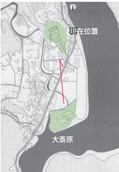
現在の社地と大斎原

今回の修理を機に、建物を観察すると、水に付いたような跡がある部材があり、洪水の被害にあったことが見て取れます。注目されるのは、第一殿・第二殿、第三殿、第四殿の各建物に墨書が沢山見られることです。「三三八」などとあって、これらは古い木の表面を削って書かれている部分もあるため、間違いなく明治移築のさいの解体番付であることがわかります。最初の「三」は第三殿という意味のようで、第四殿は略して「〇」になっていまし