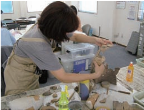
中飯降遺跡の縄文土器 復元作業中