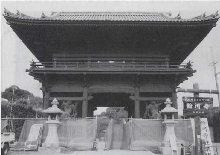
■ 大門全景（正面より見る）