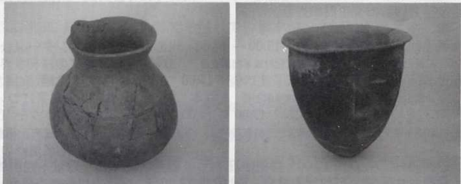
■ 出土した壺（写真左）と甕（写真右）

その後の弥生時代中期に進むにつれ、いろんな形の弥生土器に多くの文様が施されるようになり、時代の豊かさを感じさせるものとなります。今、この段階のものではっきりしているのは南部高校のある片山遺跡で出土している弥生土器ぐらいですが、調査が進むと徳蔵地区遺跡周辺でも発見されるかもしれません。