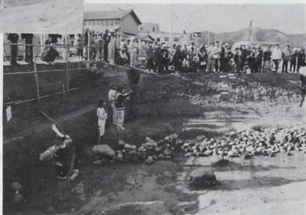
■ 内部部分 現地説明会 風景

発掘調査は、内郭部の一部分と、北外郭部の一部分を実施しました。内郭部の調査では、二重