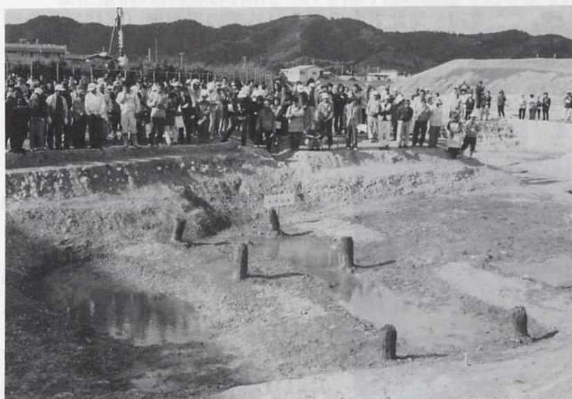
■ 北外郭部分 現地説明会 風景

〒 640 - 8268 和歌山県和歌山市広道 20 番地 Tel : 073 (433) 3843 Fax : 073 (425) 4595