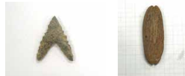
写真5 (左): 石鏃 (せきぞく: 石でできた矢じり) 写真6 (右): 石錘 (せきすい: 石でできた漁で使う重り)