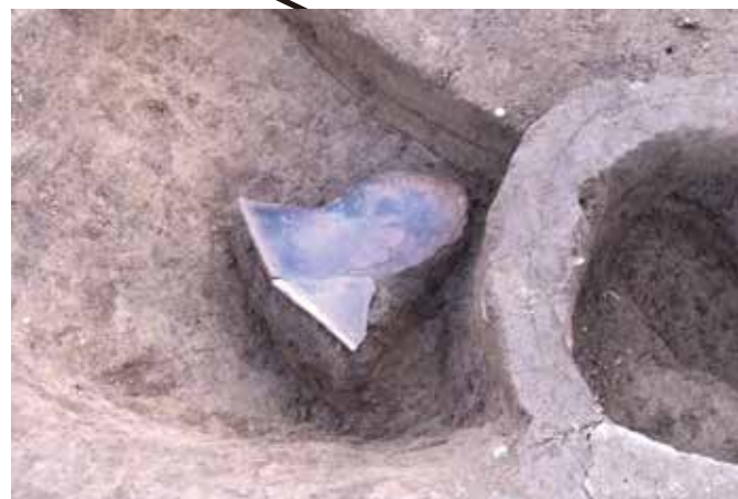
写真4 土坑2239の縄文土器出土状況