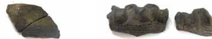
写真3 竪穴建物跡2013から出土した他地域の縄文土器