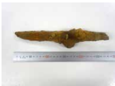
写真2 土坑381から出土した短刀